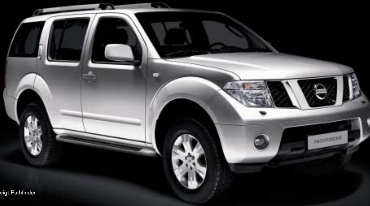
Abb. zeigt Pathfinder