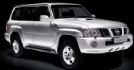
Abb. zeigt X-TRAIL, Navara, Patrol